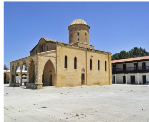
Άγιος Μάμας Μόρφου