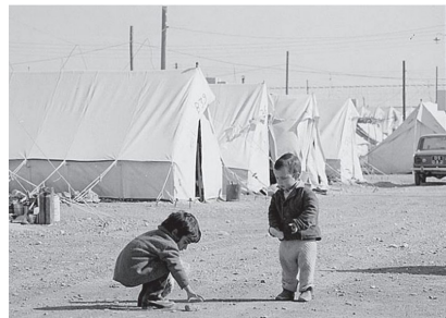
Πρώτες μέρες στους καταυλισμούς