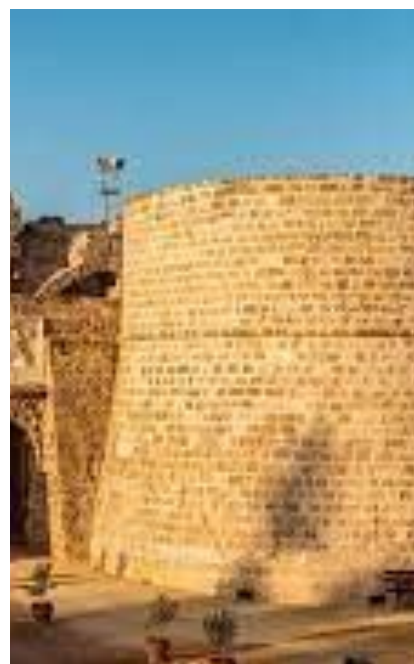
Πύργος του Οθέλλου

“ Έκλεισα τα παράθυρα και πόρτες να μη διαχύνεται η πόλη στην αυλή. Και τη μαζεύω κάτω απ' το κρεβάτι, μέσα στο ερμάρι, πίσω από τα κάδρα, στην κατσαρόλα του ατμού, στις δίπλες των βιβλίων.”